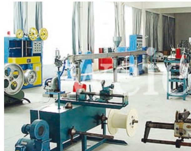
Оборудование для производства фторполимерной пленки

Фторопласт, обладая прекрасной стойкостью к любой агрессивной среде, сохраняет свои свойства при низких (-200 °С) и высоких (+250 °С) температурах, он термо-