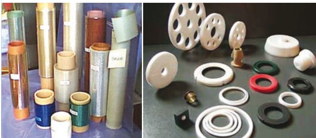
Экструзионные пленки, изоляторы, подставки, переходники и крепления из фторополимеров

Все сказанное выше предусматривает определенное время для внедрения в те отрасли промышленности и сельское хозяйство, которые не используют ФП. Однако есть ресурсосберегающие фторполимерные технологии, которые можно внедрять сегодня