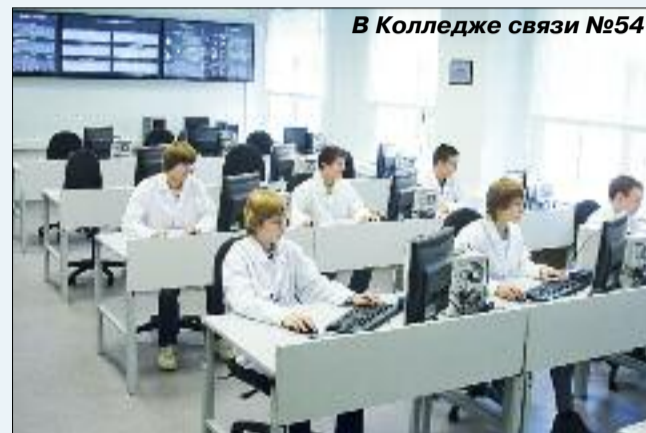
В Колледже связи №54