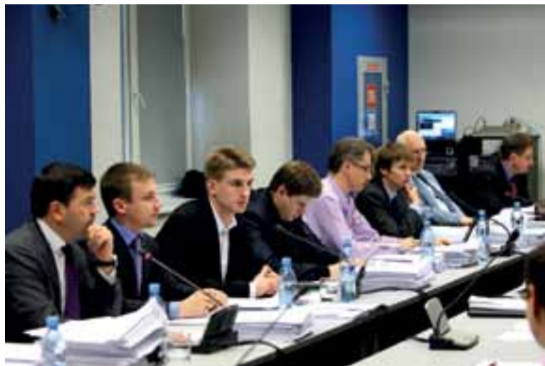
На одном из заседаний финансовой комиссии