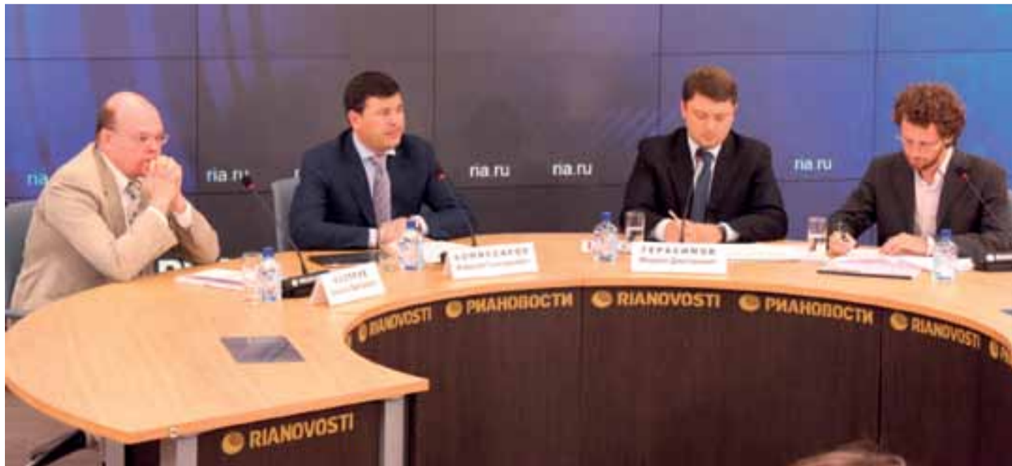
О проблемах малого бизнеса и его поддержке департаментом шла речь на одной из пресс-конференций в агентстве РИА-Новости