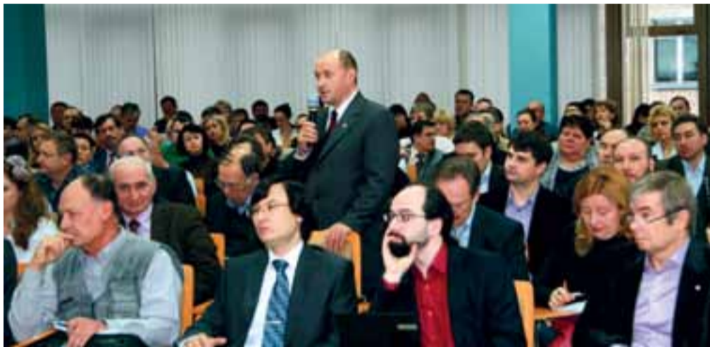
На все вопросы бизнесменов были даны конкретные ответы

не придется оплачивать услуги своего «тренера». При этом за реализацию бизнес-плана наставники не будут нести ответственность.