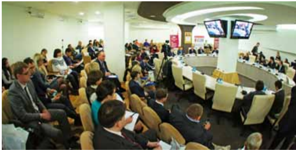
На конференции в Московской ТПП

Являясь организацией инфраструктуры поддержки малого и среднего предпринимательства города Москвы, фонд ведет работу по предоставлению поручительств по банковским кредитам, а также поручительств по банковским гарантиям. Фонд обслуживает субъекты малого и среднего предпринимательства Москвы и работает с 35 банками, которые реально осуществляют кредитование МСБ. В 2011 году на деятельность фонда из бюджета города было выделено 760 млн рублей, еще столько же фонд получит до конца года по линии софинансирования Минэкономразвития РФ.